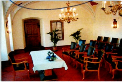
- Schlosskapelle -