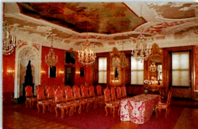
- Dalbergsaal -

Maximale Kapazität: 80-100 Personen (30 Sitzplätze).