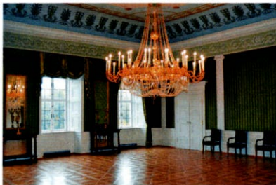
- Grünes Zimmer -

Maximale Kapazität: 50 Personen (30 Sitzplätze).